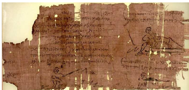
Afbeelding boven: deel van papyrusrol