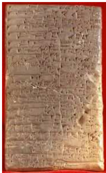
Afbeelding links: kleitablet

In de Romeinse tijd gebruikte men wasplankjes. Dit waren plankjes met een licht opgehoogde rand. Ze waren gevuld met bijenwas. Met een “stylus” konden teksten worden geschreven (met het puntje van de stylus) en worden gecorrigeerd ( met de spatelzijde van de stylus). De plankjes konden, wanneer de tekst moest worden behouden, door middel van een touwtje of een leren riempje worden gebundeld. Dit was het begin van de zgn. “codex”, de boekvorm zoals we die heden ten dage nog steeds kennen.